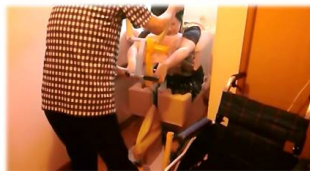
トイレからの立ち上がり